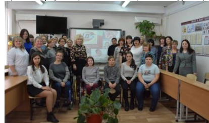
Участники Дня открытых дверей ЦДО