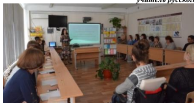
Обучающиеся ЦДО с их родителями во время мастер-класса