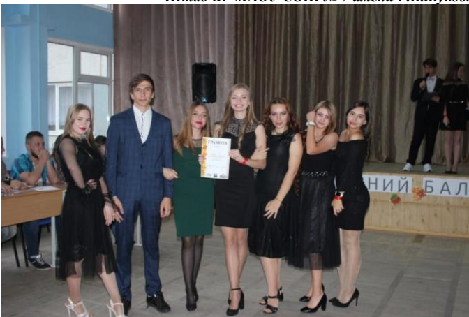
Победители «Осеннего бала»

ЗДЕСЬ МОГЛА БЫ БЫТЬ ВАША РЕКЛАМА, НО ЕЁ НИКОГДА НЕ БУДЕТ, ПОТОМУ ЧТО ЭТО ШКОЛЬНАЯ ГАЗЕТА!