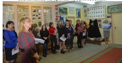
Экскурсия в школьный историко-краеведческий музей