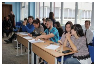
Строгое, но объективное жюри

Танцы и песни длились на протяжении почти полутора часов. Дети в этот день ушли из школы довольные и счастливые и уже в ожидании новой развлекательной программы в рамках празднования Нового 2020 года.