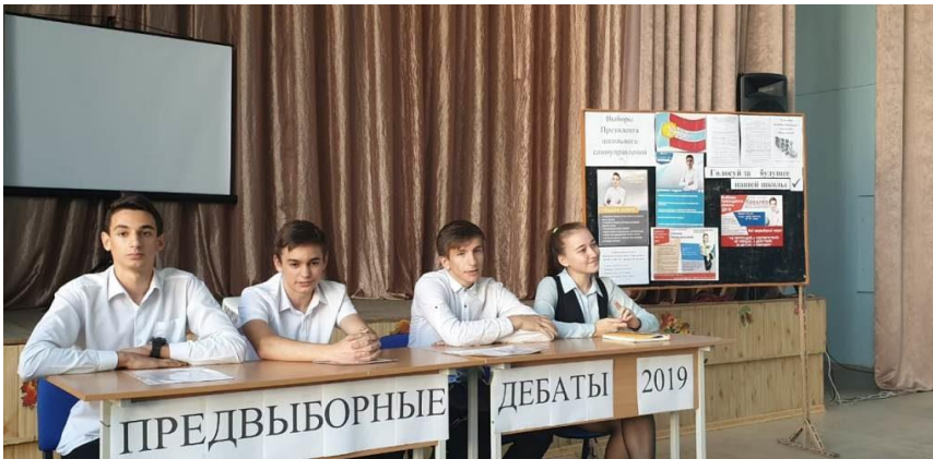
Кандидаты в президенты

21 октября во всех образовательных организациях Краснодарского края прошли выборы лидеров (президентов) ученического самоуправления.