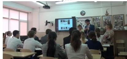
Интегрированный урок кубановедения, литературы и истории в 10 классе (М.Г.Шурдумова, А.М.Шагалов, С.В.Шокурова.)