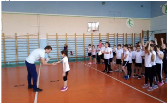
Награждение участников «Весёлых стартов»

Жюри подвело итоги соревнований. Оказалось, что 1 место заняли команды 1 «В», 2 «Б», 3 «Г», 4 «А». Команды-победительницы были награждены Грамотами. Команды, которым повезло меньше, получили Грамоты за 2-3 места и отличный заряд бодрости, а также море положительных эмоций. Соревнования стали настоящим праздником спорта, здоровья!